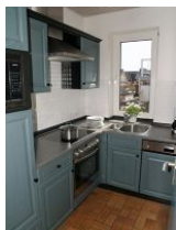
Hier ist an alles gedacht.