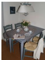
Einzelstücke mit Charakter wurden im Essbereich kombiniert.