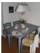
Einzelstücke mit Charakter wurden im Essbereich kombiniert.