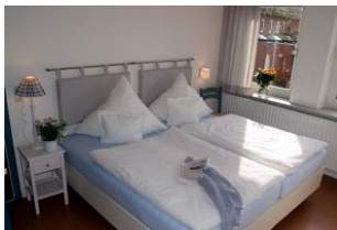
Kommen Sie uns besuchen wo das Wasser und die Weite zu Hause sind.