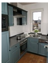
Hier ist an alles gedacht.