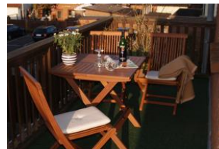
Ihr Balkon auf dem Sie Morgens und Abends die Sonne genießen können.