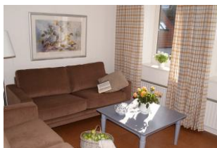
Sanfte Farben dominieren im Wohnbereich.