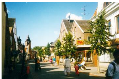
Wohnen im Herzen von Wyk.