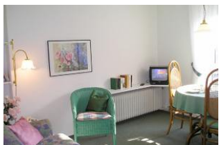
Eine kleine Wohnung und trotzdem jede Menge Platz.

Hier wohnen Sie im Herzen von Wyk, fast über den Dächern des kleinen Städtchens auf Föhr. Sie können das Meer in der Entfernung sehen und ab und zu lugt auch der Schornstein eines der Passagierschiffe lustig zwischen den Hausgiebeln hervor. Die Apartments sind sehr behaglich ausgestattet und lassen kaum Wünsche offen. In der Wohnung ist man raus aus dem Trubel der Innenstadt, doch man kann auch schnell wieder eintauchen und was auch angenehm ist - alles ist in absoluter Nähe: Strand, Einkaufsmöglichkeiten, Kuranwendungen und vieles mehr. Wir freuen uns auf Ihren Besuch.