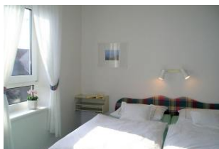
Schlafen kann man lernen.