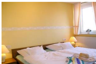
Schlafen Sie gut!