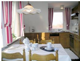
Hier kochen Sie gern.