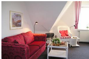
In diesem Ambiente können Sie entspannen.

Hier wohnen Sie im Herzen von Wyk, fast über den Dächern des kleinen Städtchens auf Föhr. Sie können das Meer in der Entfernung sehen und ab und zu lugt auch der Schornstein eines der Passagierschiffe lustig zwischen den Hausgiebeln hervor. Die Apartments sind sehr behaglich ausgestattet und lassen kaum Wünsche offen. In der Wohnung ist man raus aus dem Trubel der Innenstadt, doch man kann auch schnell wieder eintauchen und was auch angenehm ist - alles ist in absoluter Nähe: Strand, Einkaufsmöglichkeiten, Kuranwendungen und vieles mehr. Wir freuen uns auf Ihren Besuch.