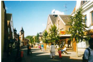
Wohnen im Herzen von Wyk